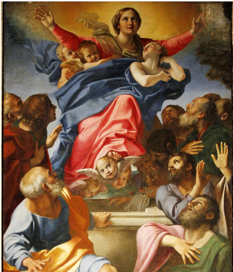
Annibale Carracci, Maria Tenhemelopneming, 16 e eeuw