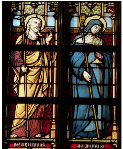
H. Philipus, H. Juliana (Onze Lieve Vrouw webstiek in Tongeren)

een teken dat Christus wilde, dat niet alleen in Luik, maar over de hele wereld jaarlijks Sacramentsdag gevierd zou worden. Als we nu het geloof hebben in de werkelijke tegenwoordigheid van Christus in de Eucharistie, dan mag dat tot uitdrukking komen in heel ons handelen. Laten we bewust naar Hem verlangen. Laten we Hem respectvol ontvangen. Laten we na de Communie ons even inkeren en tot Hem bidden. Hem dankzeggen. Niet eet en loop weg. De heilige Philip Neri deed eens het volgende. Hij zag dat iemand direct na de communie de kerk verliet. Hij stuurde meteen acolieten met kaarsen en bellen er achteraan. De man kwam geërgerd terug in de kerk. "Wat is dat voor een grap" vroeg hij aan de priester. De Heilige Philip Neri zei: "Het is geen grap. De regels van de liturgie zijn dat het Allerheiligst Sacrament met eerbied behandeld dient te worden. Jij verliet de kerk zonder gebed of dankzegging. Je draagt het heilig sacrament in je. Dus ik vroeg de acolieten jou te begeleiden om de Heer te eren." We mogen beseffen dat wij, communicanten, als tabernakels zijn of monstransen die de Heer dragen. Zo mogen we elkaar met respect benaderen. Maar ook door de week mogen we ons telkens herinneren dat we nieuwe mensen geworden zijn, gelijkend op de Heer die in ons vlees en bloed geworden is. Dat wij als monstransen God zichtbaar maken in deze wereld.