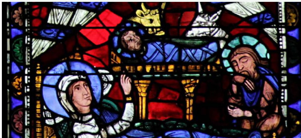
Geboorte van Jezus (kathedraal Chartres)