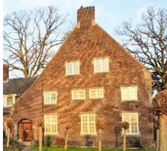
Prins Hendriklaan 378